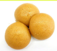
西川口まんじゅう

川口市西川口 1-2-9 048-452-8146 営業 11:00-20:00